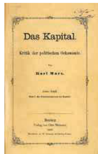
La prima edizione del libro

Il capitale venne messo in commercio l'11 Settembre del 1867. Un secolo e mezzo dopo la sua pubblicazione, esso è annoverato tra i libri più tradotti, venduti e discussi della storia dell'umanità. Per quanti vogliono comprendere cosa sia davvero il capitalismo, e anche perché i lavoratori devono lottare per una «forma superiore di società, il cui principio fondamentale sia lo sviluppo pieno e libero di ogni individuo», Il capitale è, oggi più che mai, una lettura semplicemente imprescindibile.