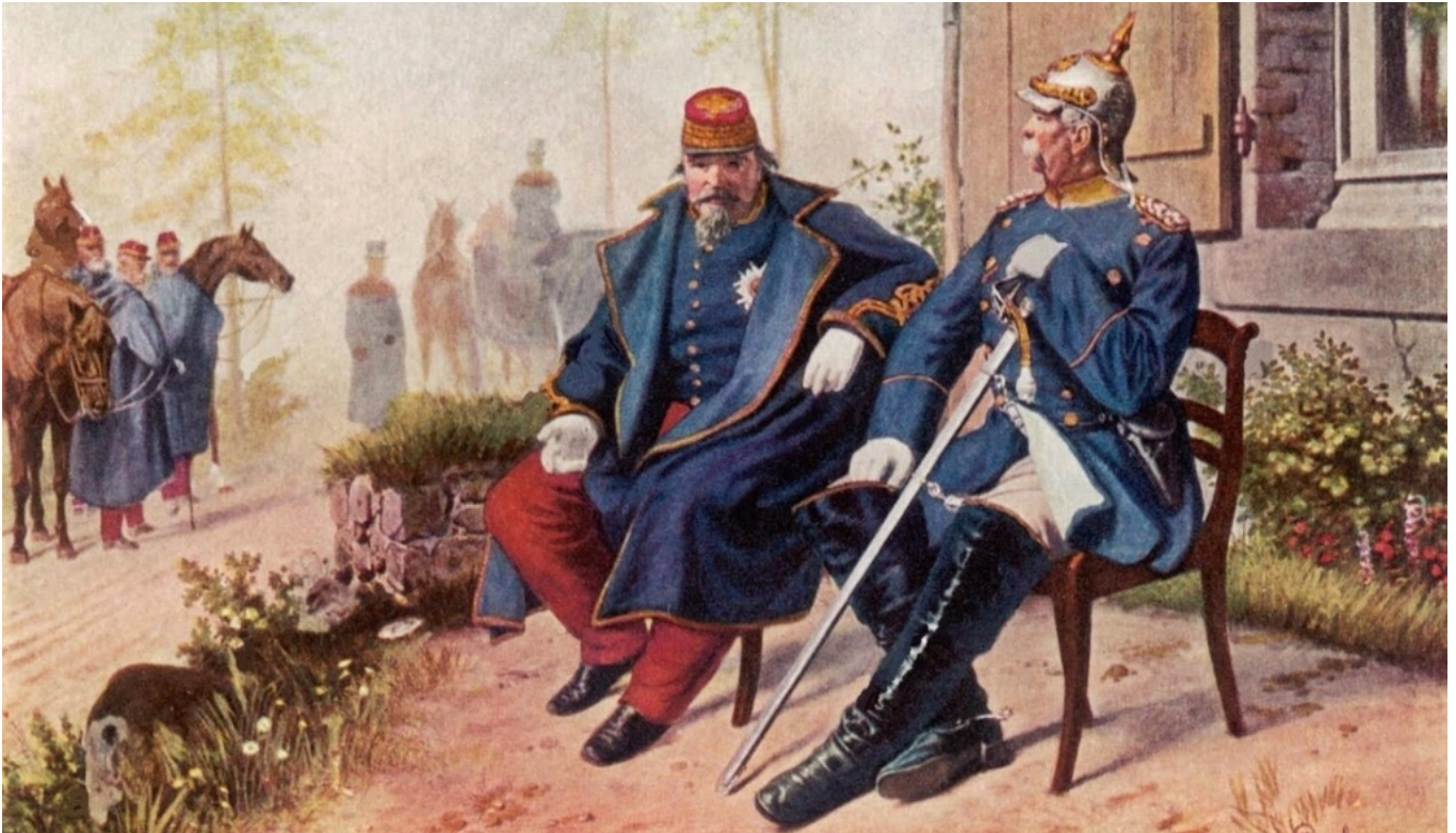
Bismarck i Napoleó III a la batalla de Sedan, quadre de Wilhelm Camphausen.

La majoria dels membres de la Comuna eren obrers o representants de la classe obrera. Catorze d'ells venien de la Guàrdia Nacional. Va ser justament el seu comitè central qui va lliurar el poder a la Comuna, tot i que això va representar l'inici d'una llarga sèrie de contradiccions i conflictes entre les dues organitzacions.