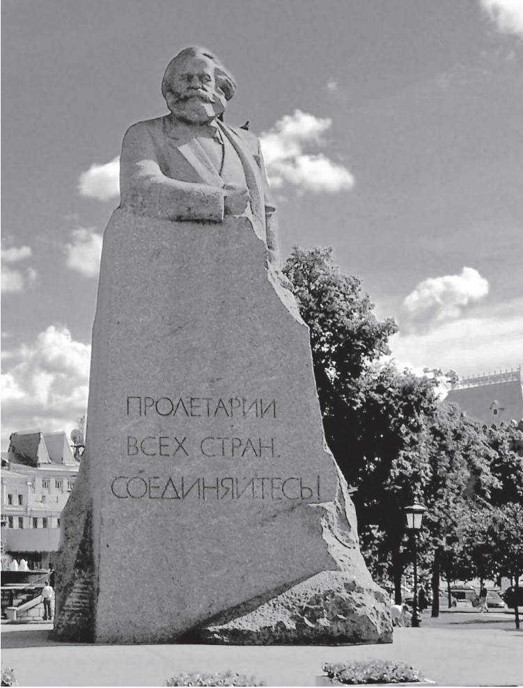
Marx anıtı, Moskova.

mümkün kılıyor. Sovyetler Birliği'nin çöküşünün ardından oluşan yeni siyasi ortam da bu yeni algıya katkıda bulunuyor. Zira Marksizm-Leninizm'in sonu Marx'ın eserini "gerçekte var olan sosyalizm"ın sınırlarından kurtarmıştır.